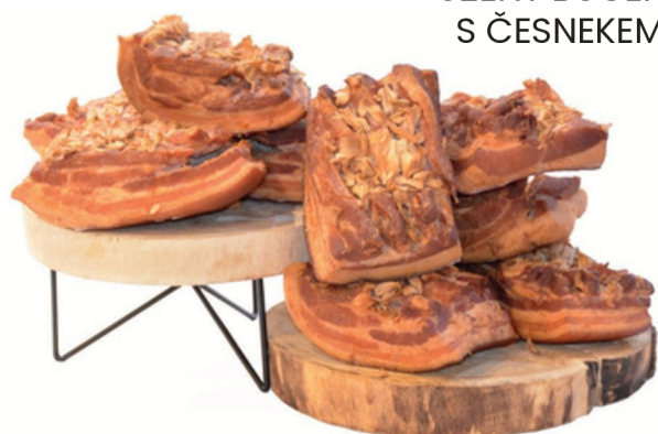
UZENÝ BŮČEK S ČESNEKEM