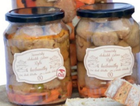
RYBÍ KARBANÁTKY PIKANT