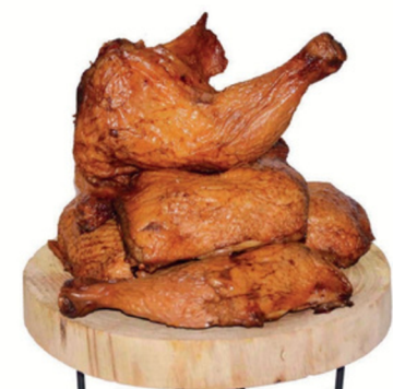
UZENÉ KUŘECÍ ČTVRTKY