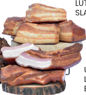
UZENÁ LUTENSKÁ SLANINA