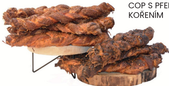
UZENÝ BŮČKOVÝ COP S PFEFFERSTEAK KOŘENÍM