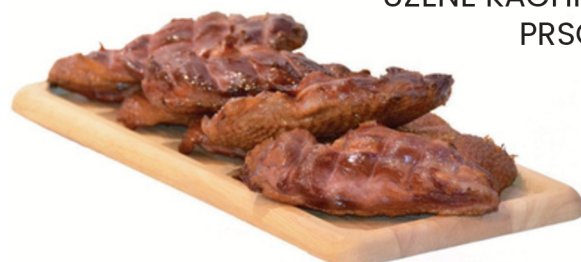
UZENÉ KACHNÍ PRSO