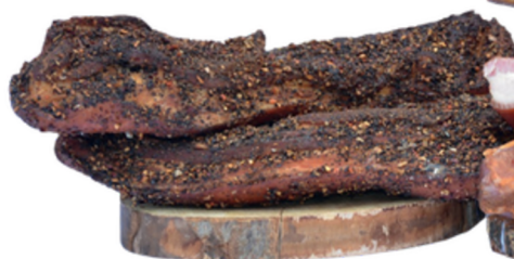
UZENÝ BŮČEK S PFEFFERSTEAK KOŘENÍM