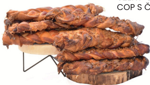
UZENÝ BŮČKOVÝ COP S ČESNEKEM