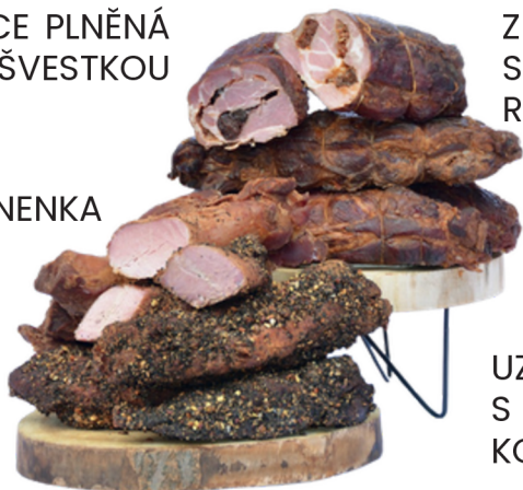
UZENÁ ROLÁDA Z KRKOVICE PLNĚNÁ SUŠENOU ŠVESTKOU